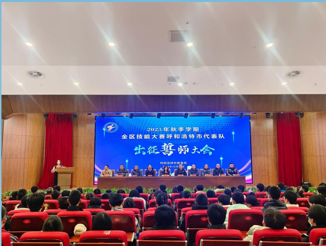
图片 2-10 2023 年秋季学期全区中等职业学校学生技能大赛出征誓师大会