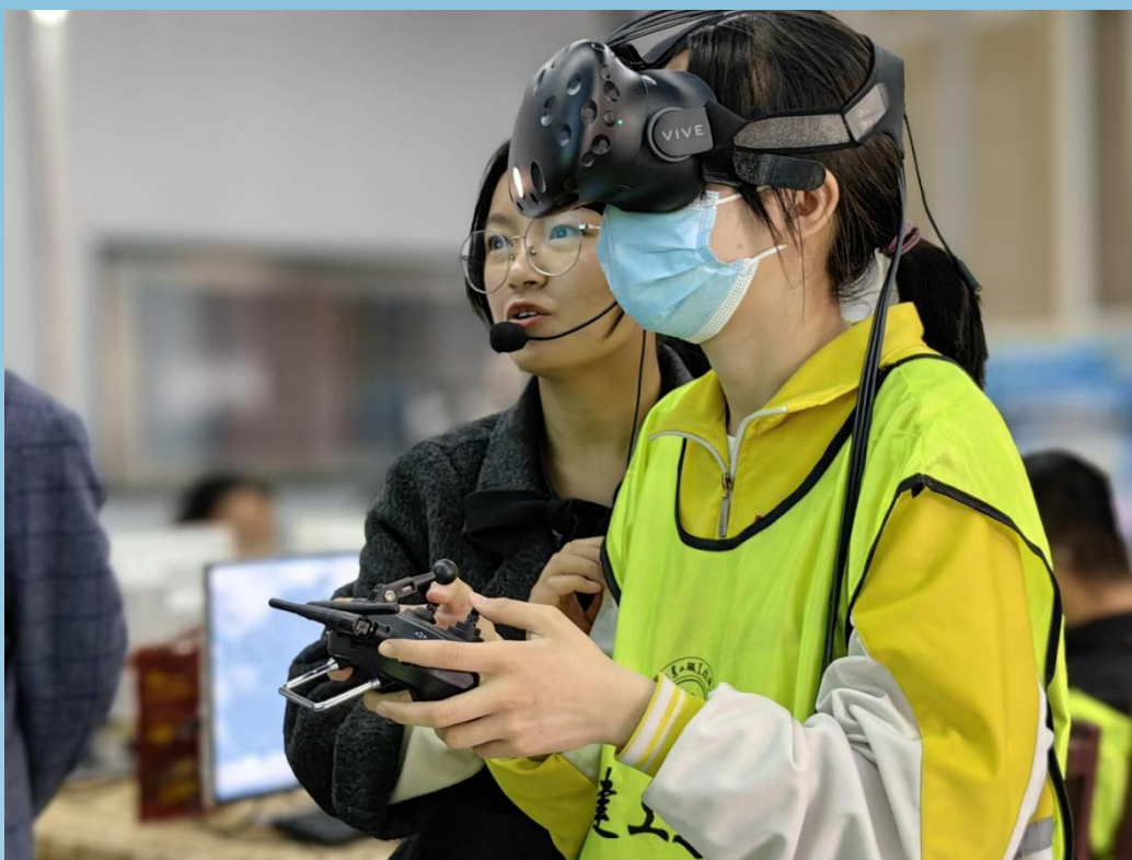
图 3-4 无人机模拟飞行体验

本次活动共有 116 名学生进行职业体验教育。开展职业体验教育，是推动职业教育资源面向基础教育开放，提升中小学综合实践活动课程、劳动与技术课程学习实施水平，促进普职融通，深入实施素质教育的重要途径。学校立足学校专业特色，精心设计符合中小学生兴趣的职业体验项目课程，强化科技、艺术、道德与职业的内在融合，促进学生的全面发展。