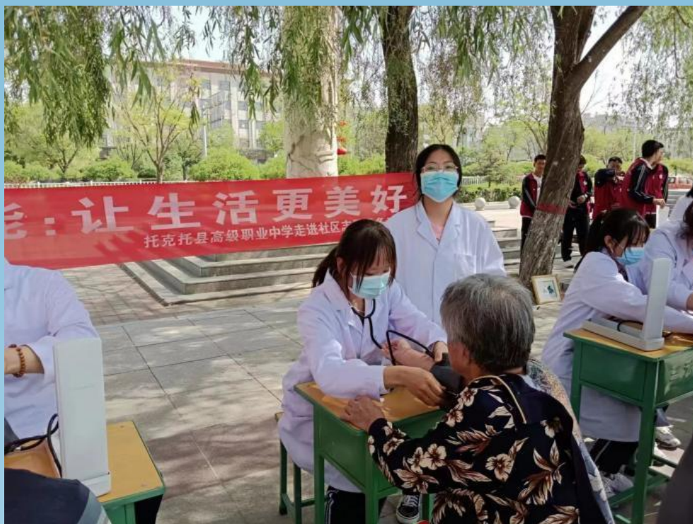
图片 3-3 托克托县高级中学开展服务社区活动

学校护理专业学生携带血压仪、血糖仪、身高体重一体智能秤等医护设备来到托克托文化广场，为广大群众开展健康护理志愿服务活动。广场群众自觉排队测量血压、血糖，学生们在测量过程中所展现的专业素养、职业精神受到广大居民的高度认可，也无形中提升了学生们“苦练技能，出彩人生”的自觉性。