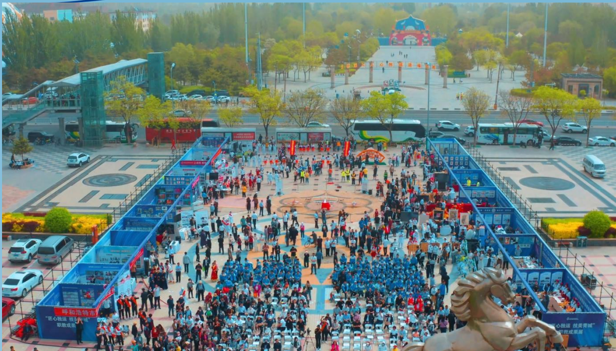
图片 7-9 2023 首府职教活动周及成果展