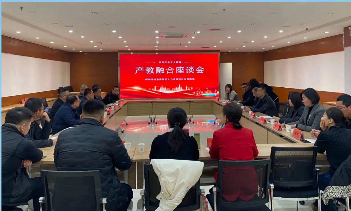
图片 6-1 “五万产业工人留呼工程”产教融合座谈会

11月10日，呼和浩特市教育局组织呼和浩特市10所中职学校与赛罕区人社局、阿特斯阳光电力集团、金山高新技术开发区、航天开发区共同开展“五万产业工人留呼工程”产教融合座谈会。