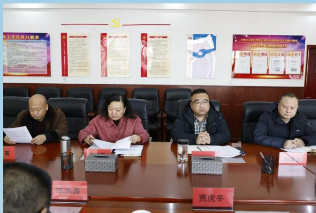
图片 7-2 呼和浩特市食品与医药卫生学校领导班子座谈会

学习创新载体、科学规划、加强监督。聚焦校园文化建设，党建引领“三全育人”体系，通过支部建设带动党员，通过党员带动全局。打造第一支部“温暖万千”支部特色品牌，带动全员育人氛围、打造第二支部“温暖随行”品牌，带动全程育人氛围。打造第三支部“温暖 360 度”，带动全方位育人氛围。学校形成党委、党支部、党员加全体师生的党建引领新格局，共同参与校园文化建设系列活动，为校园文化建设提供精神引领和平台支撑。