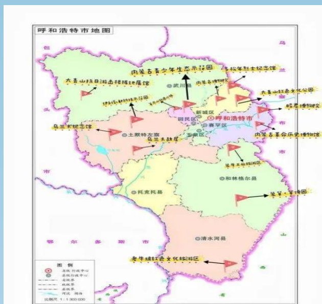
图片 2-3 呼和浩特市“红色”研学点地图

为推进教育系统学习贯彻习近平新时代中国特色社会主义思想主题教育走深走实，深入学习宣传习近平总书记关于教育的重要论述和对内蒙古重要指示精神，自治区教育厅利用暑期实践，以铸牢中华民族共同体意识为主线，充分挖掘内蒙古丰富的历史文化资源，推出系列“大思政课”红色地标打卡地，倡导广大师生开展“红色地标我打卡 思政课堂动起来”活动，不断推动思政小课堂与社会大课堂相结合，让广大师生在实践中学思践悟、知行合一。