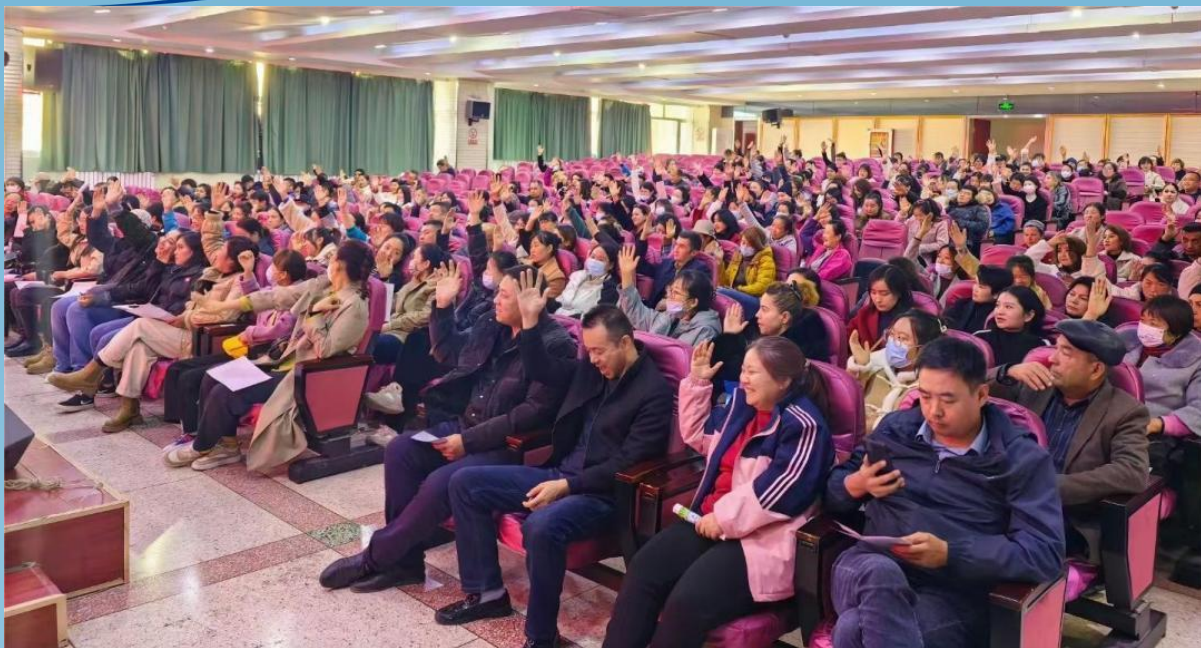
图片 3-2 乡村振兴网络安全培训