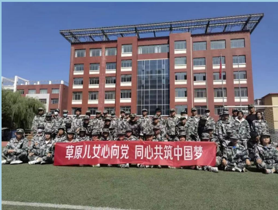
图片 7-4 “三联”活动

2023 年 9 月是第 40 个民族团结进步活动月，为充分发挥学校主阵地作用，呼和浩特市食品与医药卫生学校开展民族团结进步月活动，开展融于国防教育、融于班会和融于实训课之中的“三融”活动。发挥师生主体作用，在民族团结进步月活动中开展学习创新、课堂创新和活动创新的“三创”活动。发挥党员干部先锋性，以民族团结进步、铸牢中华民族共同体意识为主题，开展联系师生、联系社区、联系企业的“三联”活动。