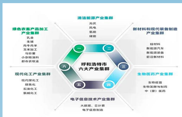
图片 2-5 呼和浩特市“六大产业集群”