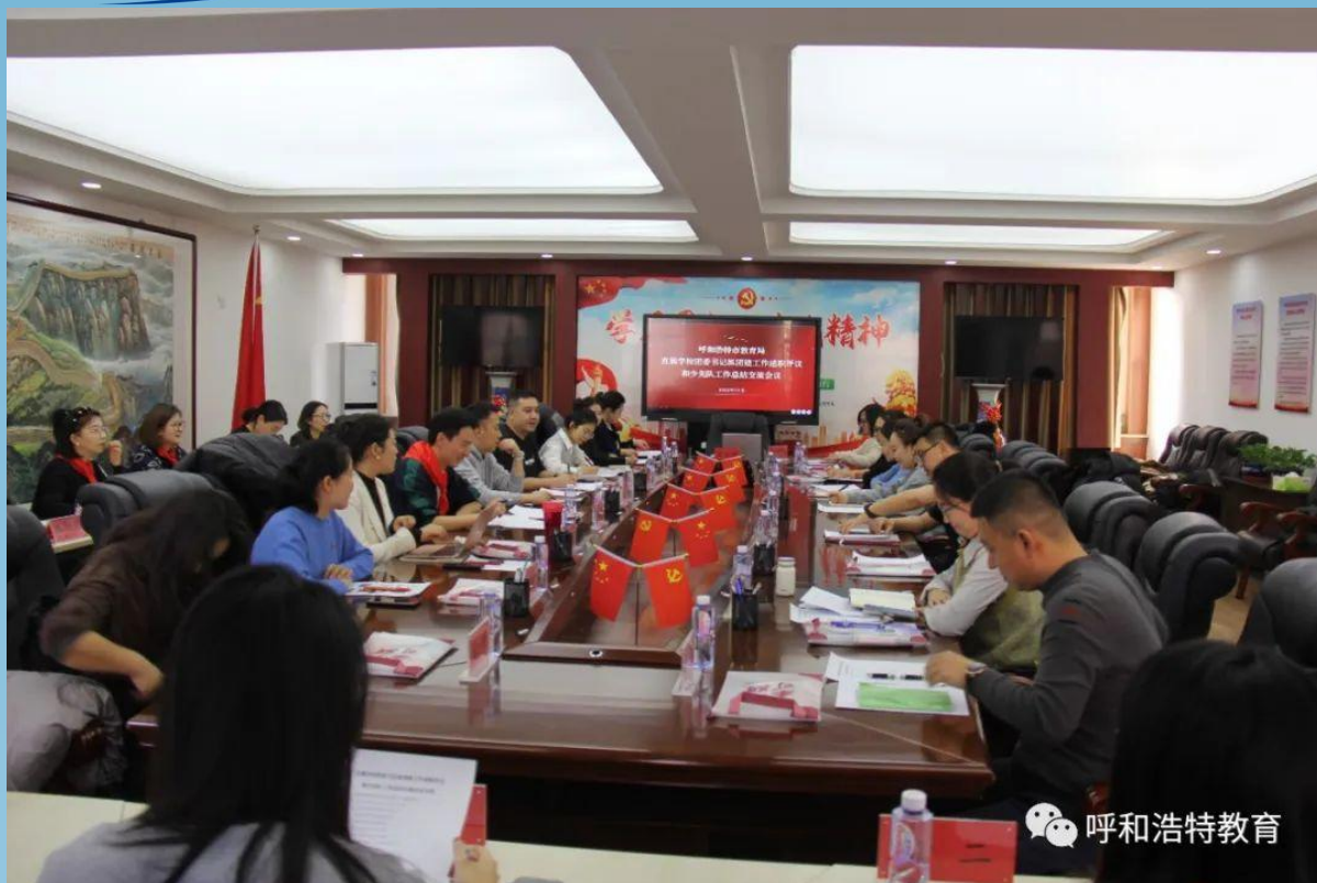
图片 7-5 团委书记抓团建工作述职评议和少先队工作总结交流会议