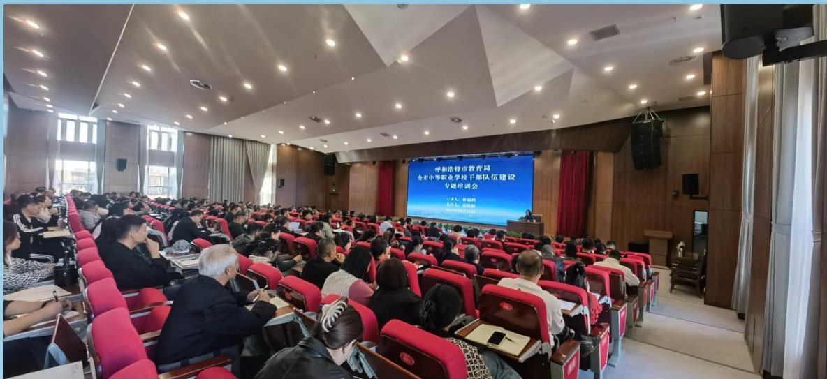
图片 7-6 呼和浩特市教育局召开中等职业学校干部队伍建设专题培训会

10月13日下午三点，全市中等职业学校干部队伍建设专题培训会在呼和浩特市教育局召开，本次培训紧紧围绕主题教育“以学铸魂 以学增智 以学正风 以学促干”的重要要求，邀请自治区教育厅职业与成人教育处处长林福利同志作《落实落地改革措施要求，推动职业教育高质量发展》专题培训，为首府职业教育“把脉”“引航”。各旗县区教育局分管职业教育领导、各职业学校领导班子、环节干部、专业组长及骨干教师300余人参加了本次培训。