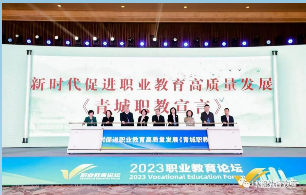
图片 7-8 呼和浩特市教育局发布促进职业教育高质量发展《青城职教宣言》