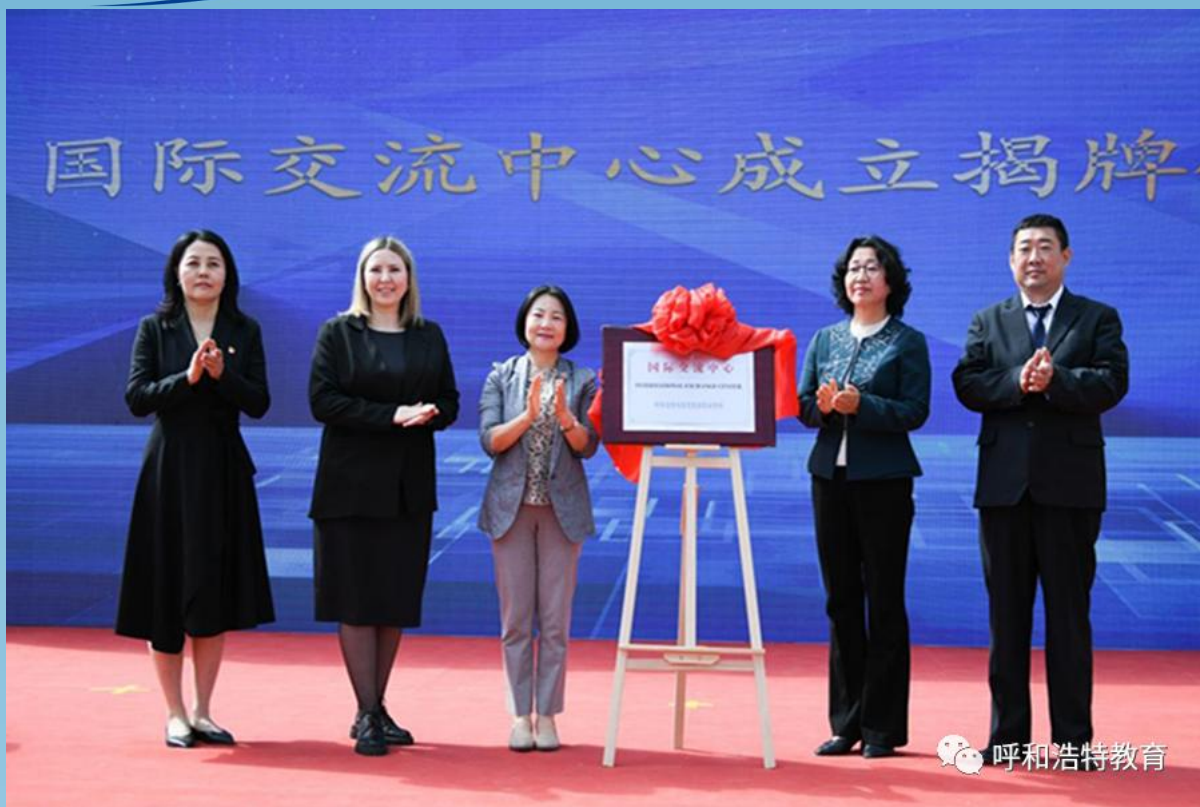
图片 5-1 国际交流中心成立