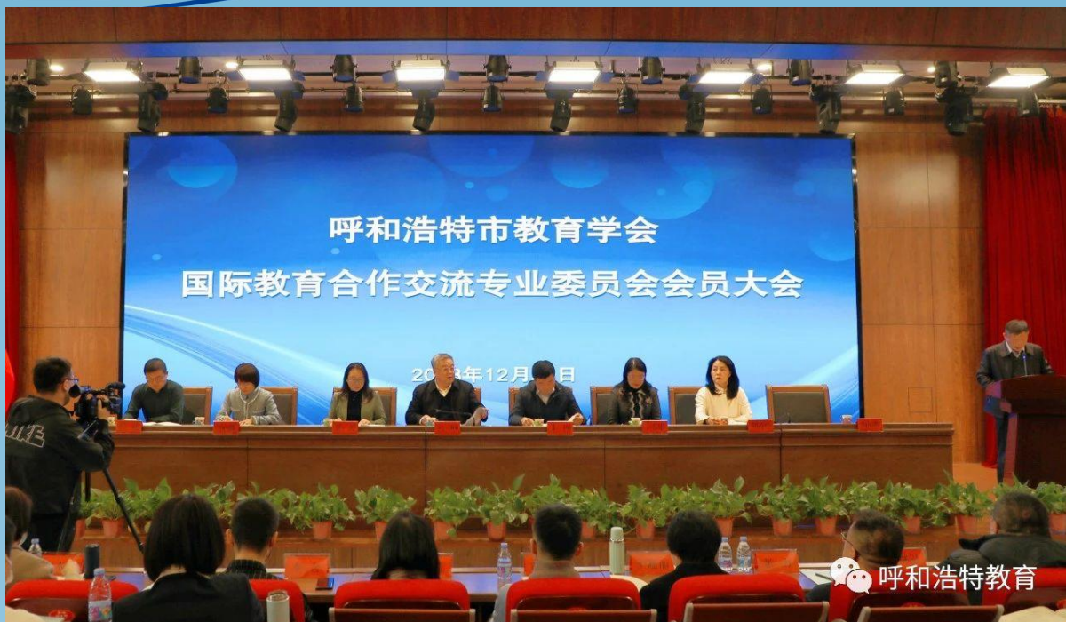
图片 5-2 国际教育合作交流专业委员会成立