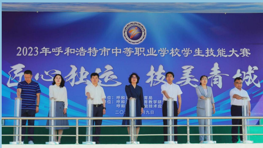
图片 2-8 2023 年呼和浩特市中等职业学校技能大赛暨技能成果展

本届技能大赛以“匠心独运 技美青城”为主题，全面展示呼和浩特市中等职业教育教学成果和技能水平，助力呼和浩特市职业教育高质量发展。赛程为期四天，在市智能技术应用学校、市商贸旅游职业学校、市文化艺术职业学校、市食品与医药卫生学校、市现代信息技术学校等 9 所学校设立 10 个赛点，共有来自全市 23 所职业学校的 815 名选手分别参加信息技术、交通运输、设备制造、旅游服务、休闲保健、土木建筑、农林牧渔、财经商贸、医药卫生、文化艺术、学前教育、文化教育、公共管理与服务、教育与体育共 14 个专业类别 51 个项目的比赛。