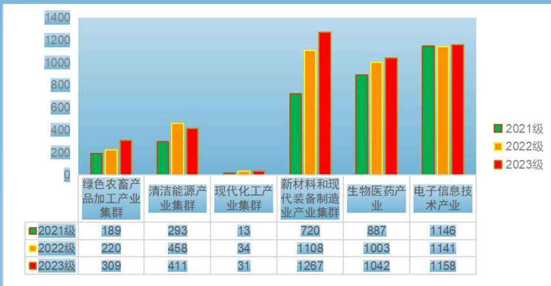
图片 2-4 对接“六大产业集群”在校人数呈逐年上升趋势