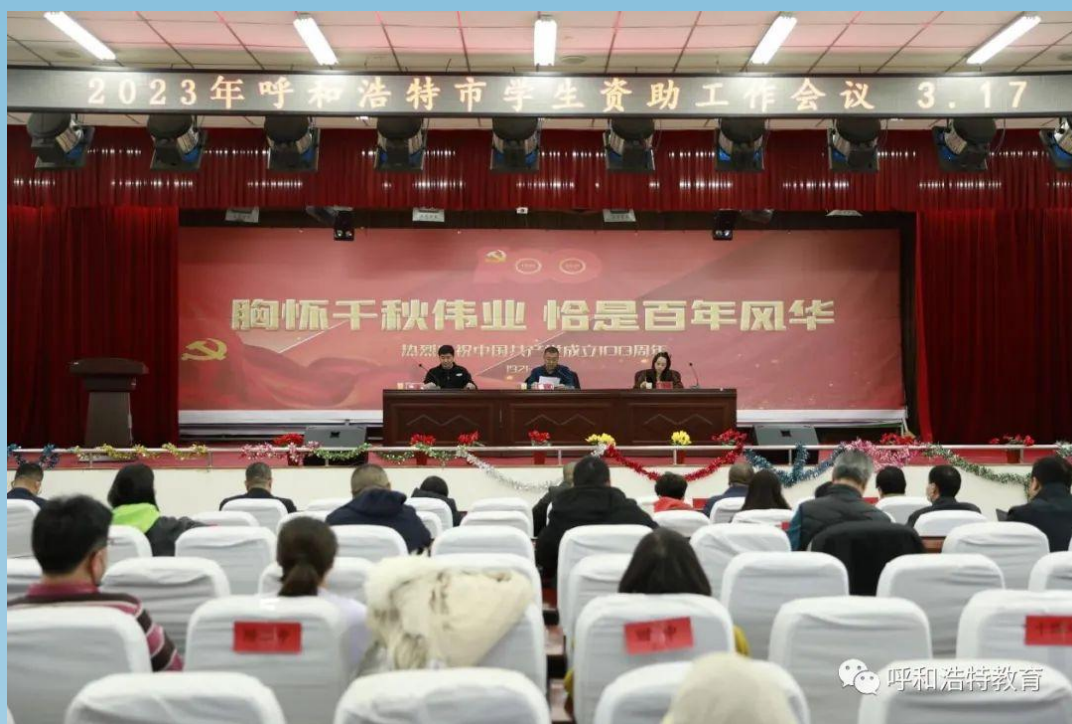
图片 2-7 学生资助工作会议的顺利召开

本次学生资助工作会议的顺利召开，使资助工作人员更深入地了解资助政策，明确工作流程，理清工作思路和方法，提升资助育人成果，真正把“立德树人”落到实处。