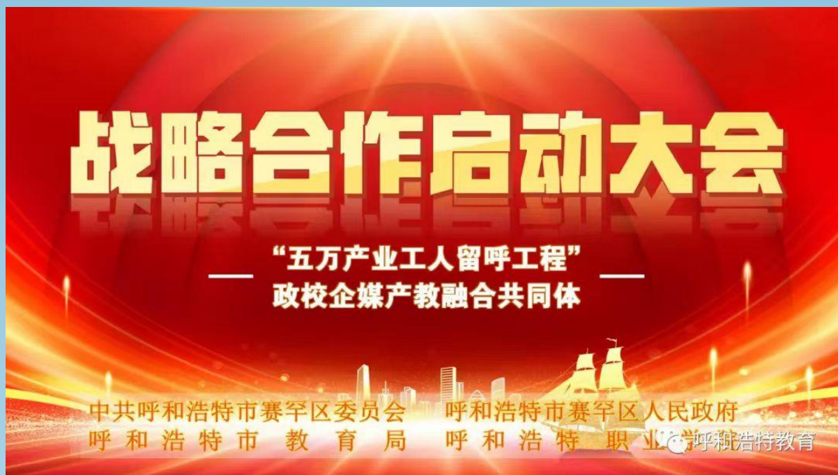
图片 6-2 “五万产业工人留呼工程”政校企媒产教融合共同体战略合作启动大会

下一步，呼和浩特市教育局将与各方代表一道，共同引领各“共同体”成员单位，以实施 3 年“五万产业工人留呼”为载体，构建以产引教、以产定教、以产促教的产教融合、协同育人模式，加快培养更多高素质技术技能人才，为全市推进产教融合纵深发展提供“赛罕经验”，探索开辟“产教融合+高质量充分就业”新路径，培育厚植人才“第一资源”，激发创新“第一动力”。