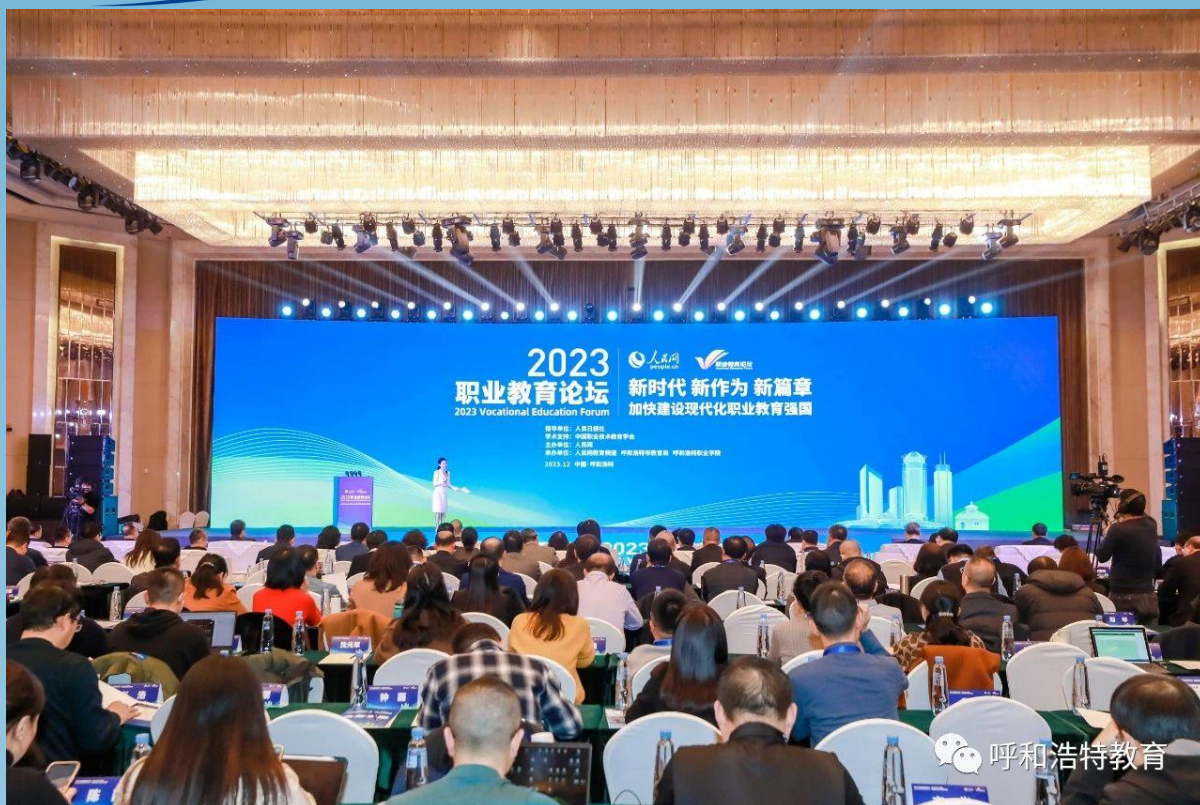
图片 7-7 2023 职业教育论坛在呼和浩特成功举办