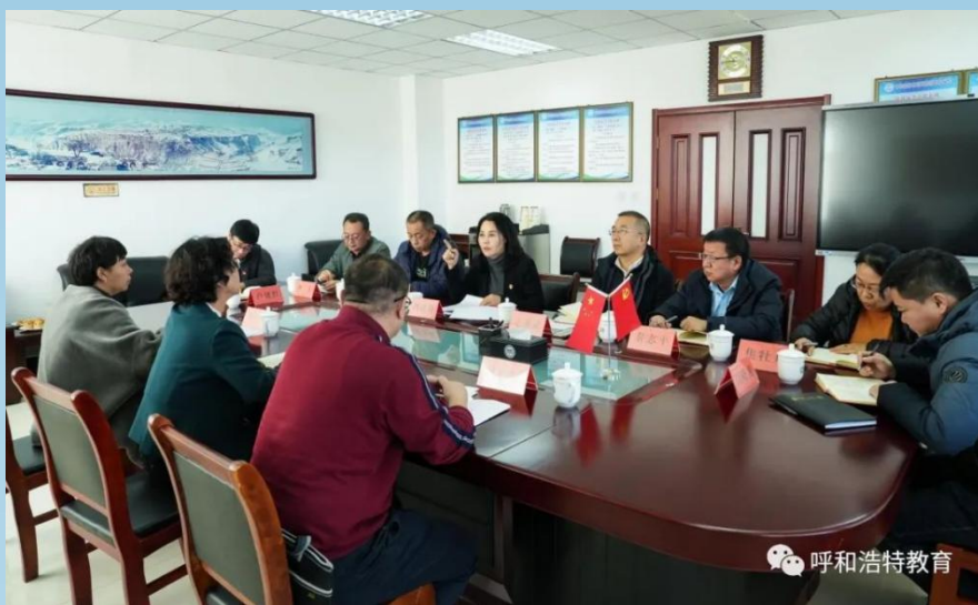
图片 7-3 王文梅局长到呼和浩特市商贸旅游职业学校开展调研工作

为进一步推进主题教育在全市教育系统内走深走实，贯彻落实好“四下基层”的任务要求，市教育局党组书记、局长王文梅到呼和浩特市商贸旅游职业学校开展调研工作。王文梅局长强调：一是要处理好学和做的关系。结合教育工作实际，注重“以学促干”，保证主题教育取得扎实成效。二是要做好主题教育与业务工作的融会融通。在课程设置、教师培养、学生全面发展等方面下功夫，提升学校教育教学水平。三是抓好支部学习教育。明确支部工作任务，通过理论学习和工作实践发挥党员先锋模范作用，积极做好先进典型选树工作，形成干事创业的良好氛围。