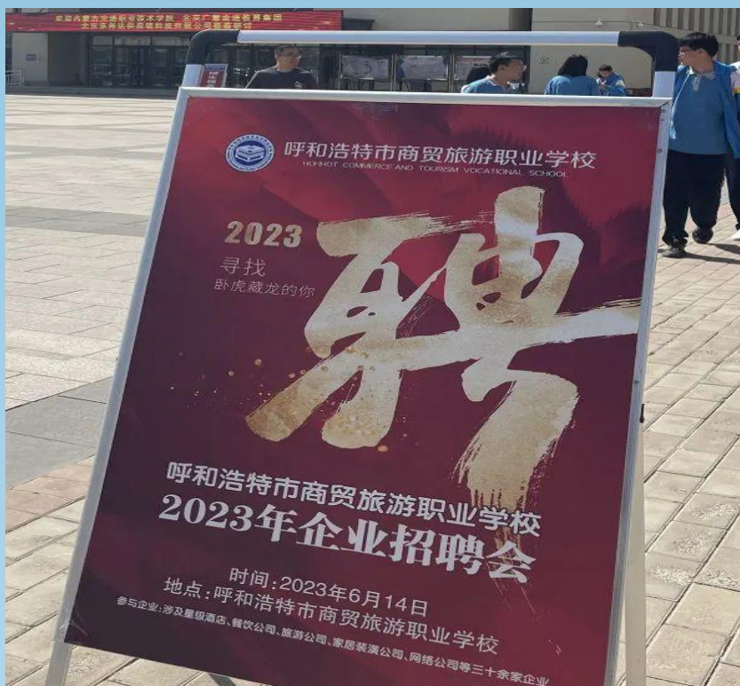
图片 2-13 呼和浩特市商贸旅游职业学校 2023 年企业招聘会

本次招聘会邀请了内蒙古饭店、希尔顿欢朋酒店、内蒙古大厦、呼和浩特香格里拉酒店、西贝餐饮公司、北京汉王影研科技有限公司、内蒙古恒宾国际旅行社、呼和浩特市城市人家华杰美居装饰设计工程有限公司等区内外近 30 余家企业前来参会，提供烹饪、机电、计算机、旅游、财会、工美设计等近 600 余个工作岗位，为学生提供了广泛的选择机会。