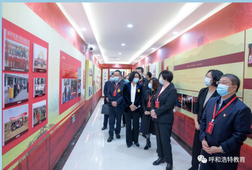
图片 7-1 党建引领教育高质量发展经验交流现场会

会议的主要目的是深入贯彻落实市第十三次党代会精神和自治区党委常委、市委书记包钢关于加强学校党建的工作要求。通过现场观摩、学习、交流，切实提升全市学校党建工作水平，引领首府教育高质量发展不断走深走实。会议强调，要通过抓引领、抓基础、抓体系、抓队伍来推动全市教育系统党建工作进一步提质增效。要持续深化党风廉政建设和反腐败斗争、全力推进师德师风建设、坚决落实管党治党主体责任，并且切实把责任压得实而又实，从而推动全市教育系统党建工作再上新台阶。