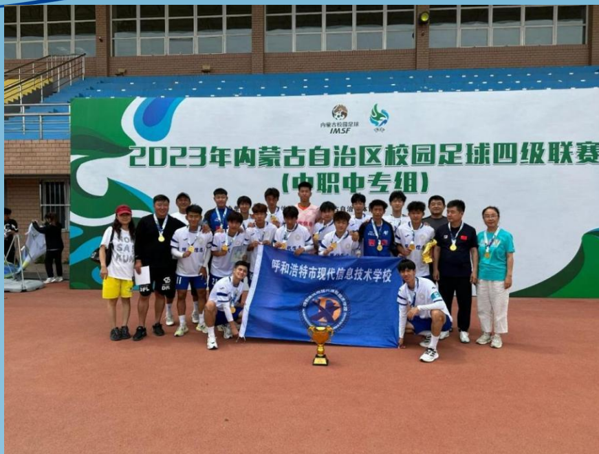
图片 2-6 荣获自治区“主席杯”校园足球四级联赛（中职中专组）冠军